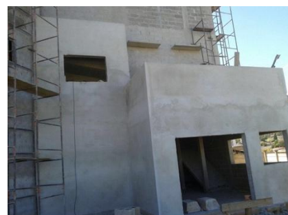
Figura 2. Fase atual da obra da nova sede.

A alternativa será realizarmos eventos menores, procurar outros parceiros e investir em nosso bazar permanente, que está funcionando praticamente todos os dias da semana.