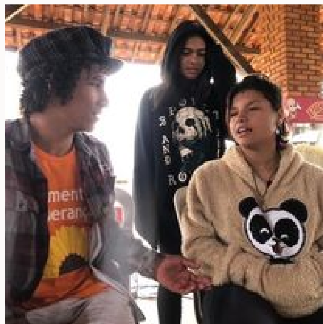
Teatro para o 18 de maio