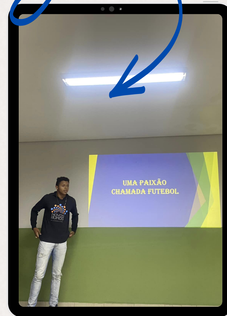
5 apresentações de cocnclusão de curso - Produto Final