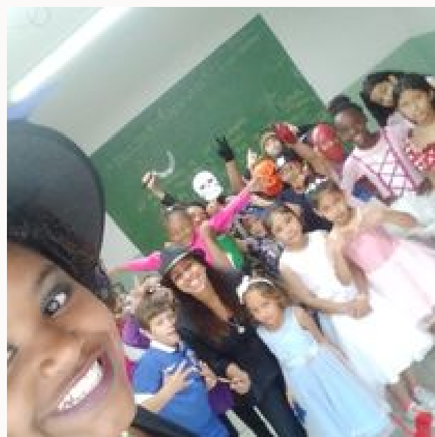
Festa à Fantasia