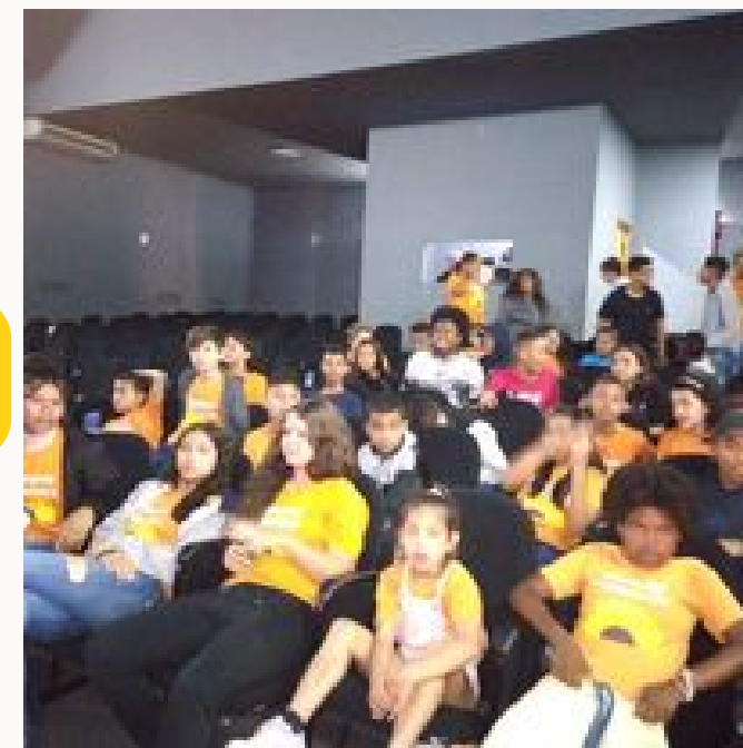
Peça teatral "Como é linda minha rua"