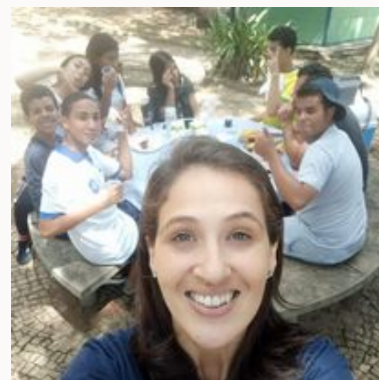
Passeio ao Taquaral Visita à Luxxótica Culinária com a ABRASEL e Metrocam