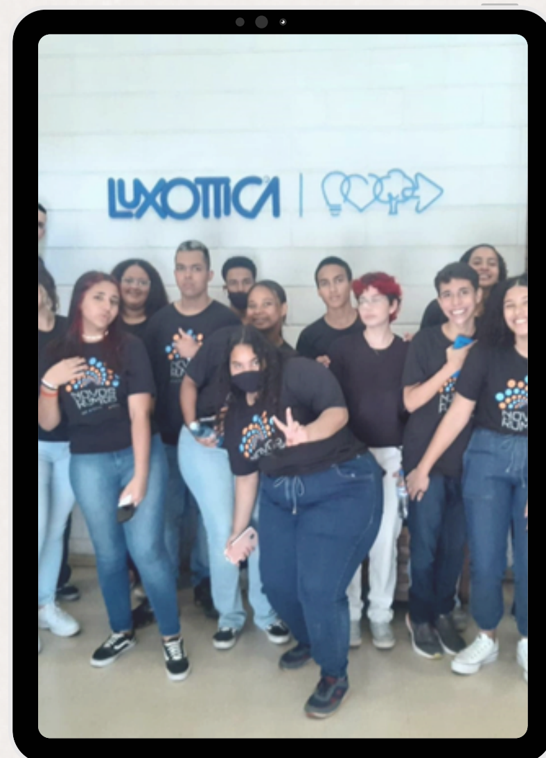
Visita à Luxxótica