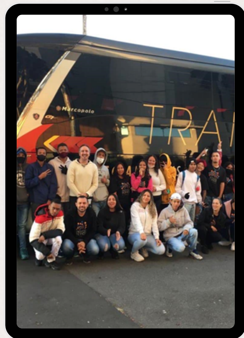
Passeio ao Museu Catavento -SP